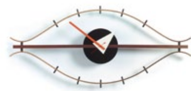
Eye Clock, laiton/noix, H 340 x L 760