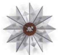
Flock of Butterflies, aluminium, Ø 610