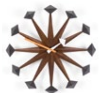
Polygon Clock, noyer, Ø 430