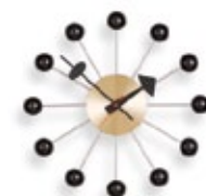
Ball Clock, noir/laiton, Ø 330