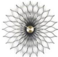
Sunflower Clock, frêne noir/laiton, Ø 750