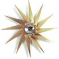
Turbine Clock, laiton/aluminium, Ø 765