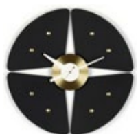
Petal Clock, noir/laiton, Ø 448