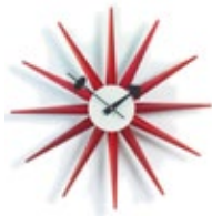
Sunburst Clock, rouge, Ø 470