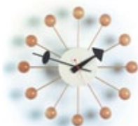
Ball Clock, naturel, Ø 330