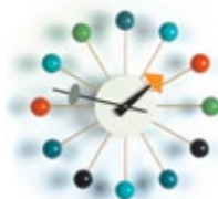
Ball Clock, multi- colore, Ø 330