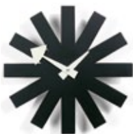
Asterisk Clock, noir, Ø 250