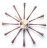
Spindle Clock, aluminium, noyer massif, Ø 577