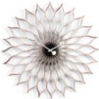
Sunflower Clock, bouleau, Ø 750