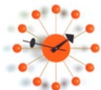
Ball Clock, orange, Ø 330