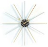
Star Clock, chrome/laiton, Ø 610