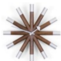
Wheel Clock, noyer/aluminium, Ø 455