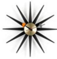
Sunburst Clock, noir/lai- ton, Ø 470