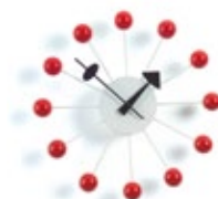
Ball Clock, rouge, Ø 330