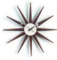
Sunburst Clock, noix, Ø 470