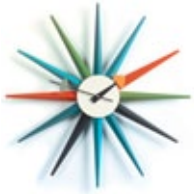
Sunburst Clock, multicolore, Ø 470