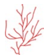
Algue, rouge clair