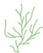
Algue, vert clair