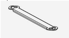
Séparateur dos contre dos

Dimensions: 37,5 x 49,6 cm. Poids: 3,5 Kg